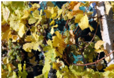
SLOVAKIAN VELTLINSKE ZELENE