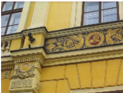
BANSKA STIAVNICA kaupungintalo

Maanantai aamuna hyvästelemme Nitran kaupungin ja lähdemme Stiavnice Vrhyn kukkuloiden yli Banska Stiavnican kaupunkiin. Matkalla näemme massiiviset tekoallasrakennelmat, joista johdettiin vesivoimaa kaupungin kaivosteollisuuden rattaisiin. Kaupungissa aistimme kävelykierroksella menneen ajan vaurautta ja perehdymme turkkilaisotien aikaan Uuden linnan näyttelyssä ( MIKÄLI PÄÄSTÄVÄT MAANANTAINA ).